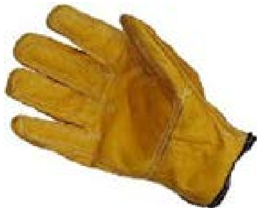
GUANTE EN VAQUETA TIPO INGENIERO REFORZADO EN PALMA Y DEDOS