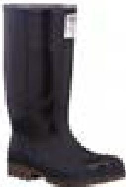
BOTA DE SEGURIDAD PUNTA DE ACERO WORKMAN SAFETY