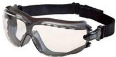
GAFA GOGGLE ALTIMETER, CLARO ANTIEMPAÑANTE CUMPLE ANSI Z87.1