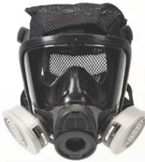
CARA COMPLETA RESPIRADOR ADVANTAGE 4200