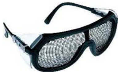
GAFA EN MALLA MARCA MSA