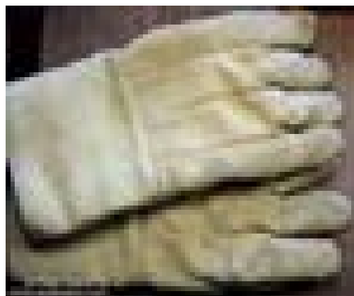
GUANTE EN CARNAZA