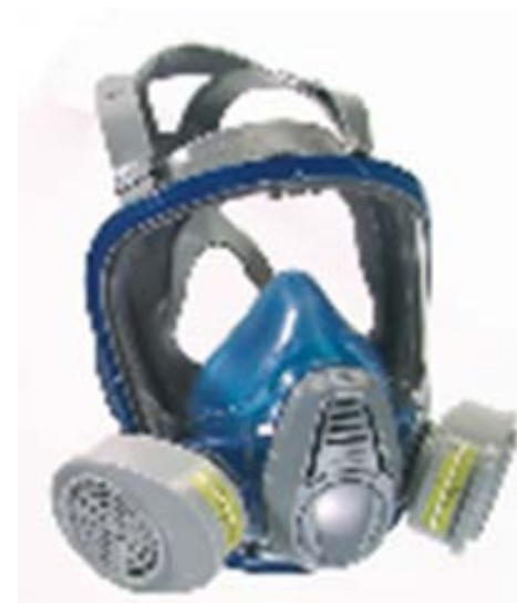
CARA COMPLETA RESPIRADOR ADVANTAGE 3200

EQUIPOS DE SEGURIDD MINERA E INDUSTRIAL, QUE PROTEGEN LA SALUD Y LA VIDA