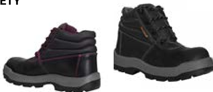
BOTA RIVER CREEK SEGURIDAD REF: 202-700