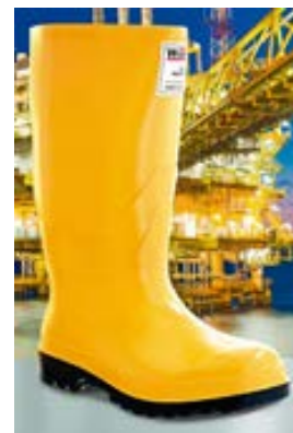
BOTA EN CAUCHO / PVC CON PUNTERA WORKMAN OIL RESISTANT