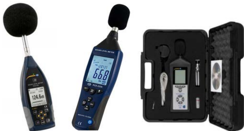
SONOMETRO TIPO 1 MARCA PCE- 430

SONÓMETROS, MEDICIÓN DE RUIDO Y EL ANÁLISIS DE FRECUENCIA MARCA PCE - EXTECH