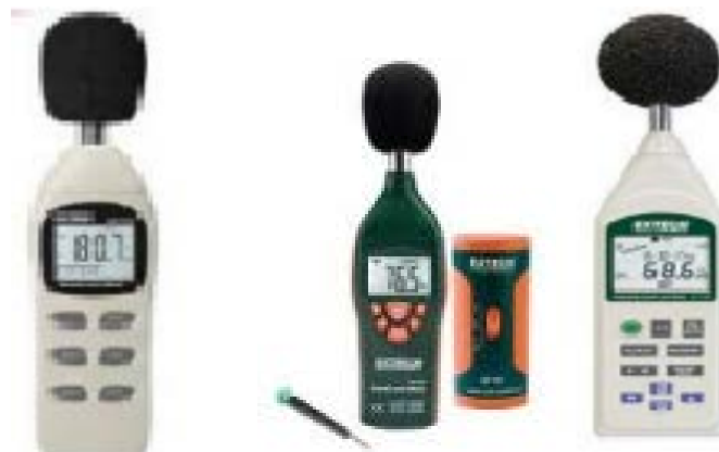
SONOMETRO MARCA EXTECH

EQUIPOS DE SEGURIDAD MINERA E INDUSTRIAL, QUE PROTEGEN LA SALUD Y LA VIDA