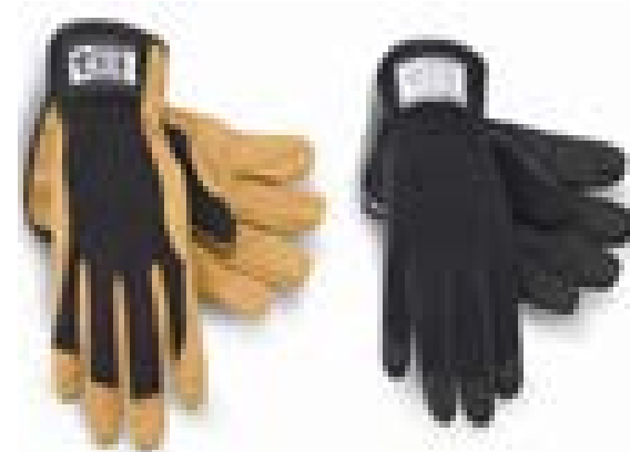
GUANTE EN VAQUETA TIPO INGENIERO REFORZADO EN PALMA Y DEDOS

EQUIPOS DE SEGURIDD MINERA E INDUSTRIAL, QUE PROTEGEN LA SALUD Y LA VIDA