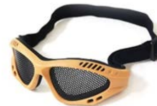
GAFA DE SEGURIDAD CON VISOR TIPO MALLA - NARA SAFE