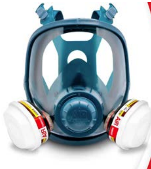
RESPIRADOR DE ROSTRO COMPLETO AIR SERIE FFS990, CON SELLO VÁLVULA MAX FLOW