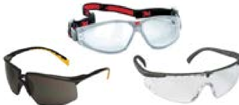
GAFA DE SEGURIDAD MARCA STEELPRO

EQUIPOS DE SEGURIDAD MINERA E INDUSTRIAL, QUE PROTEGEN LA SALUD Y LA VIDA