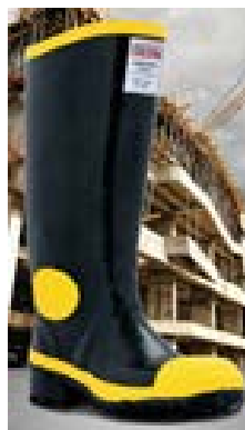
BOTA EN CAUCHO ROYAL ARGYLL SAFETY